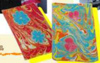
トルコ大使館ブースの マーブリングアート作品