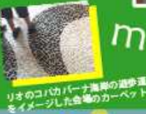
リオのコパカバーナ美術館の道歩道 をイメージした会場のカーペット