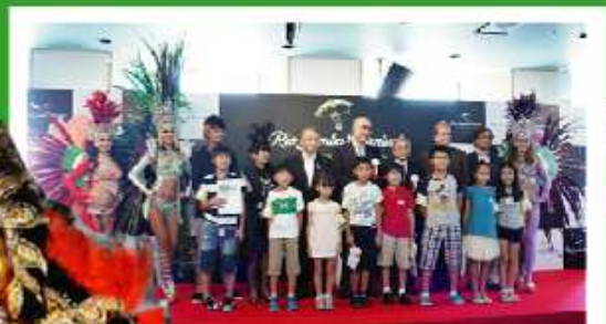
オープニングセレモニーにて集合写真