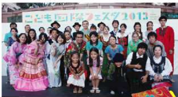
SOMOS国際ファッションショー