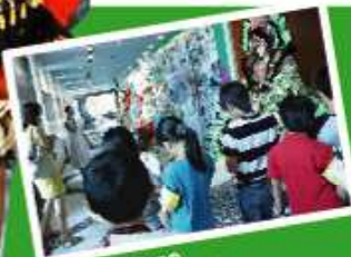
ブラジルについての 説明をしていただきました