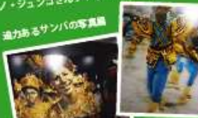
迫力あるサンパの写真展