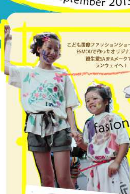
こども国際ファッションショー ESMODで作ったオリジナルシャツと 資生堂SABFAメイクで ランウェイへ!

異文化理解を目的とした、子ども向け体験型学習イベントです。 外務省後援のもと、40カ国の大使館が参加協力。今年で5年目を迎えました。