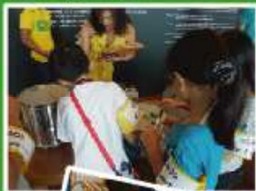
サンパの楽器にも詳し