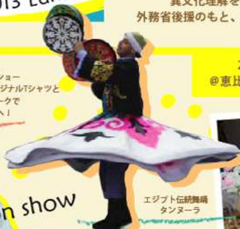
エジプト伝統舞踊 タンヌーラ