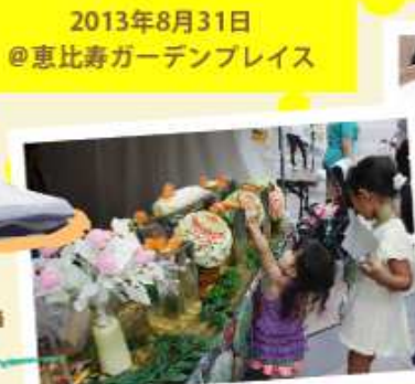
2013年8月31日 @恵比寿ガーデンプレイス