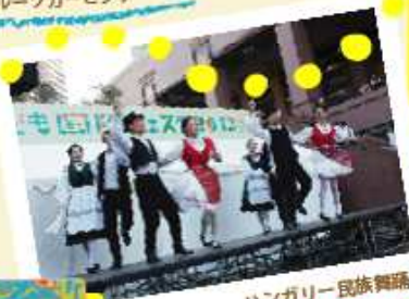
ハンガリー民族舞踊