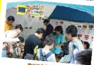
欧州連合(EU)ブースにて 旗ゲームとフェイスペインティング