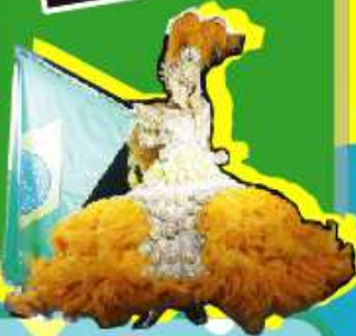
Schoolでは、ブラジルについて 事前学習をしました。