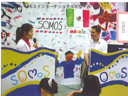
目黒区 ソモス インターナショナルスクール

代々木公園などで大使館や政府観光局が主催するフェスティバルが開かれ、食や音楽をはじめ各国カルチャーを体感できる機会として人気 出典：外務省「駐日外国公館リスト」より