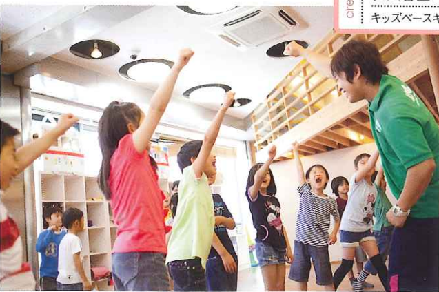
世田谷区 キッズベースキャンプ

後を過ごすための施設で増えているのが、高付加価値のサービスを設けた「学童保育」だ。城南エリアを中心に展開する「キッズベースキャンプ」は、社会や経済の仕組み、基本的な礼儀とマナーなどを学ぶ。子どもが自ら考える力や社会性を身に付けるための場所は都心に広がりそうだ。